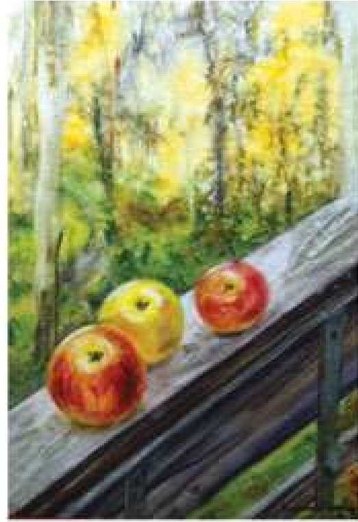
Галина Кравченко. Осінні яблука. Денши. 2018. Папір, акварель. 59,4x42