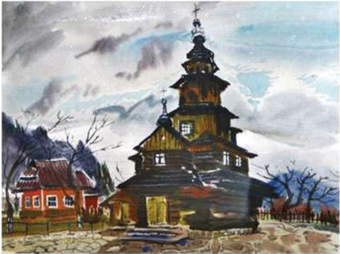
Анатолій Кравченко. Монастир в Прикарпатті. 2009. Папір, акварель. 29,5x42