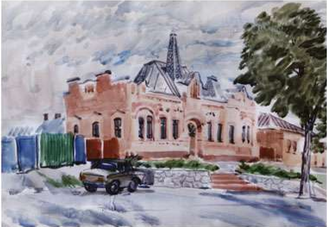
Анатолій Кравченко. Музей Осмьоркіна. Із серії «Кіровоград». 2015. Папір, акварель, 40x60