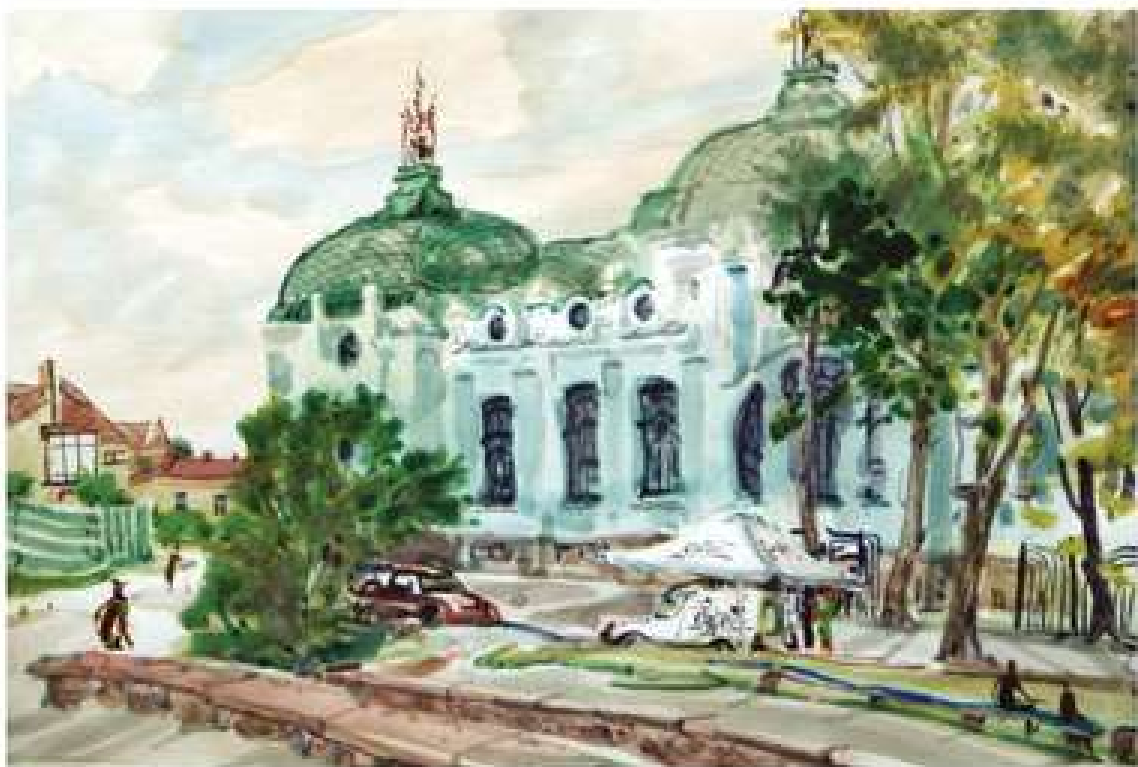
Анатолій Кравченко. Кропивницький. Ранок. 2018. Папір, акварель, 40x60