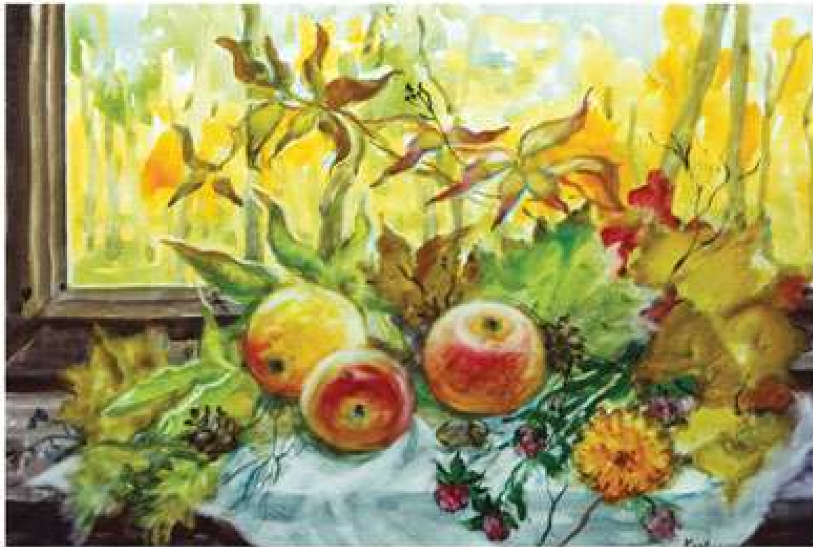
Галина Кравченко. Натюрморт на тлі осені. 2018. Папір, акварель. 39x55