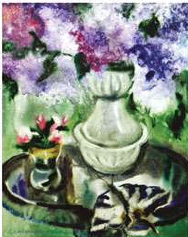
Галина Кравченко. Час коли цвіте бузок. 2018. Папір, акварель. 25x30