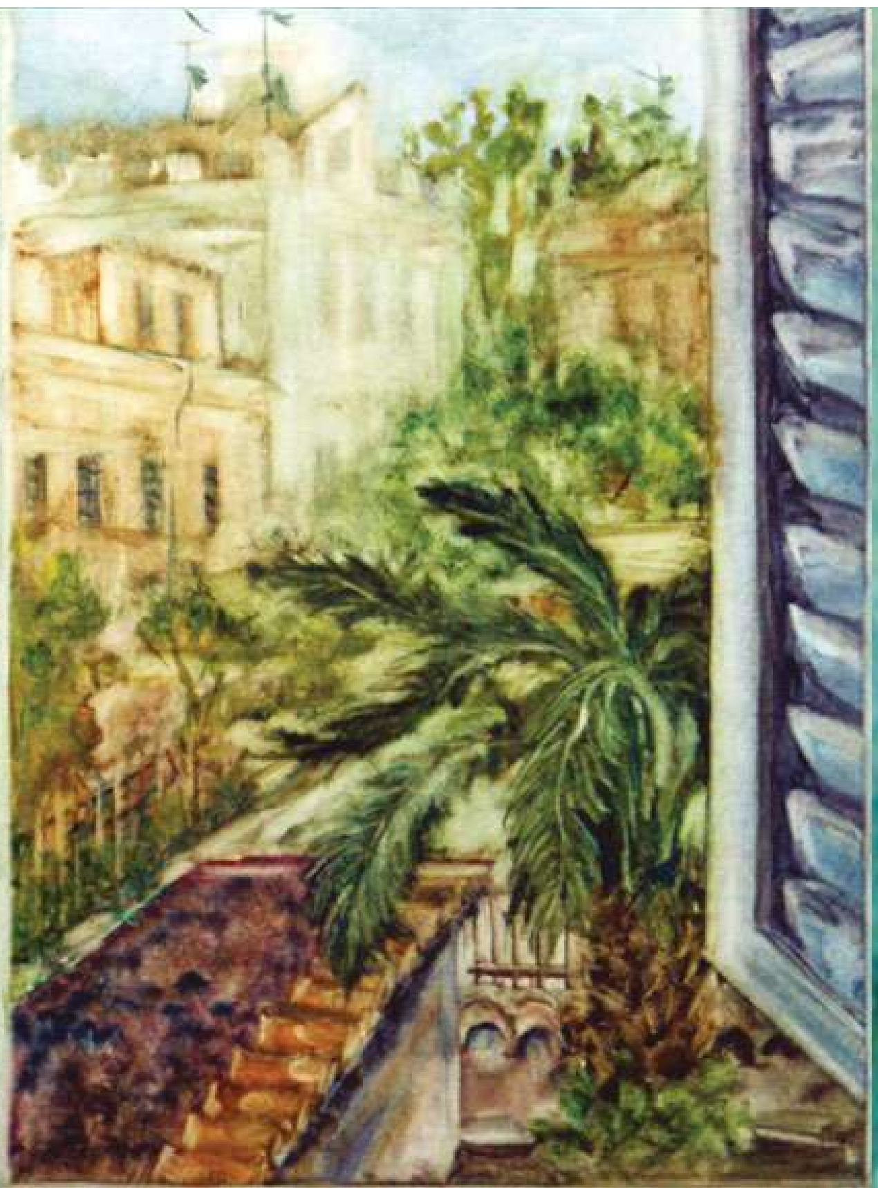
Галина Кравченко. Римський дворик з вікна, 2017. Папір, акварель, 40x30