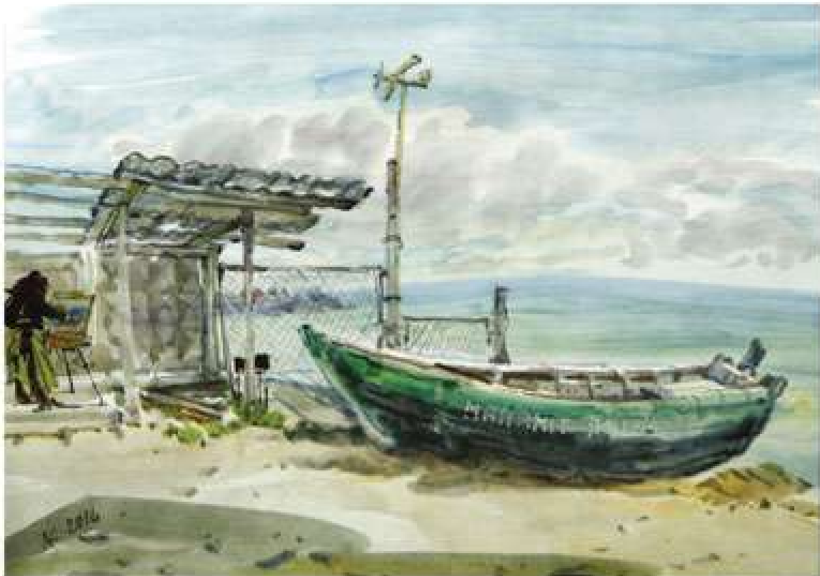
Анатолій Кравченко. Художник на морі. Січавка. 2016. Папір, акварель. 40x60