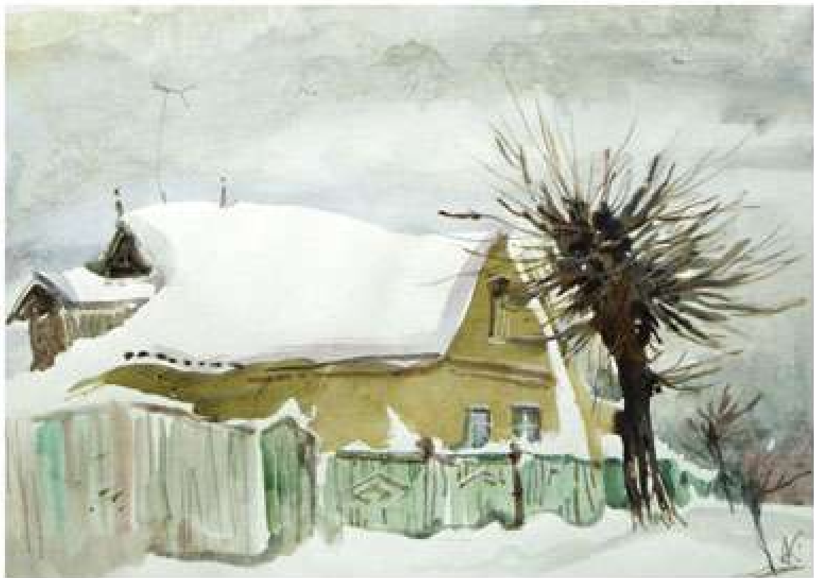
Анатолій Кравченко. Зима. Немирів. 2018. Папір, акварель. 40x60