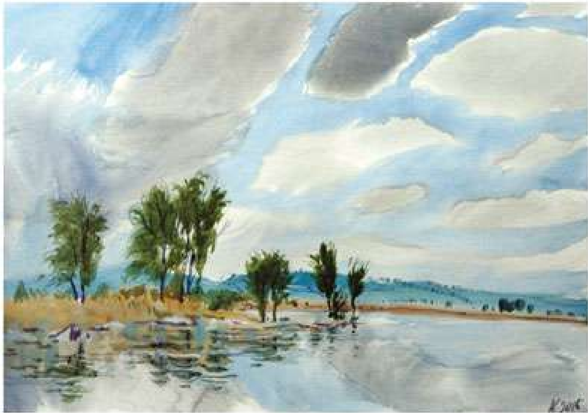
Анатолій Кравченко. Пейзаж з хмарами. Село Бірки. Серія «Кіровоградщина». 2014. Папір, акварель. 40x60