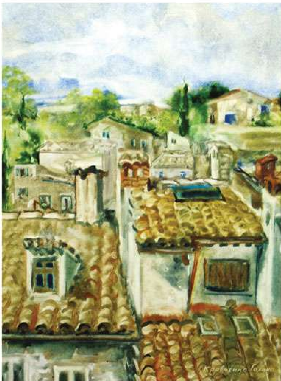
Галина Кравченко. Урбіно. Дахи. Італія 2016. Папір, акварель. 40x30