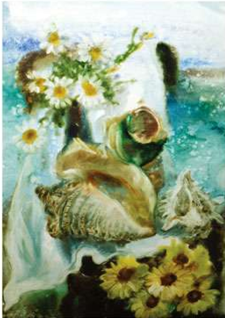
Галина Кравченко. Ромашки та мушлі. 2018. Папір, акварель, 68x48