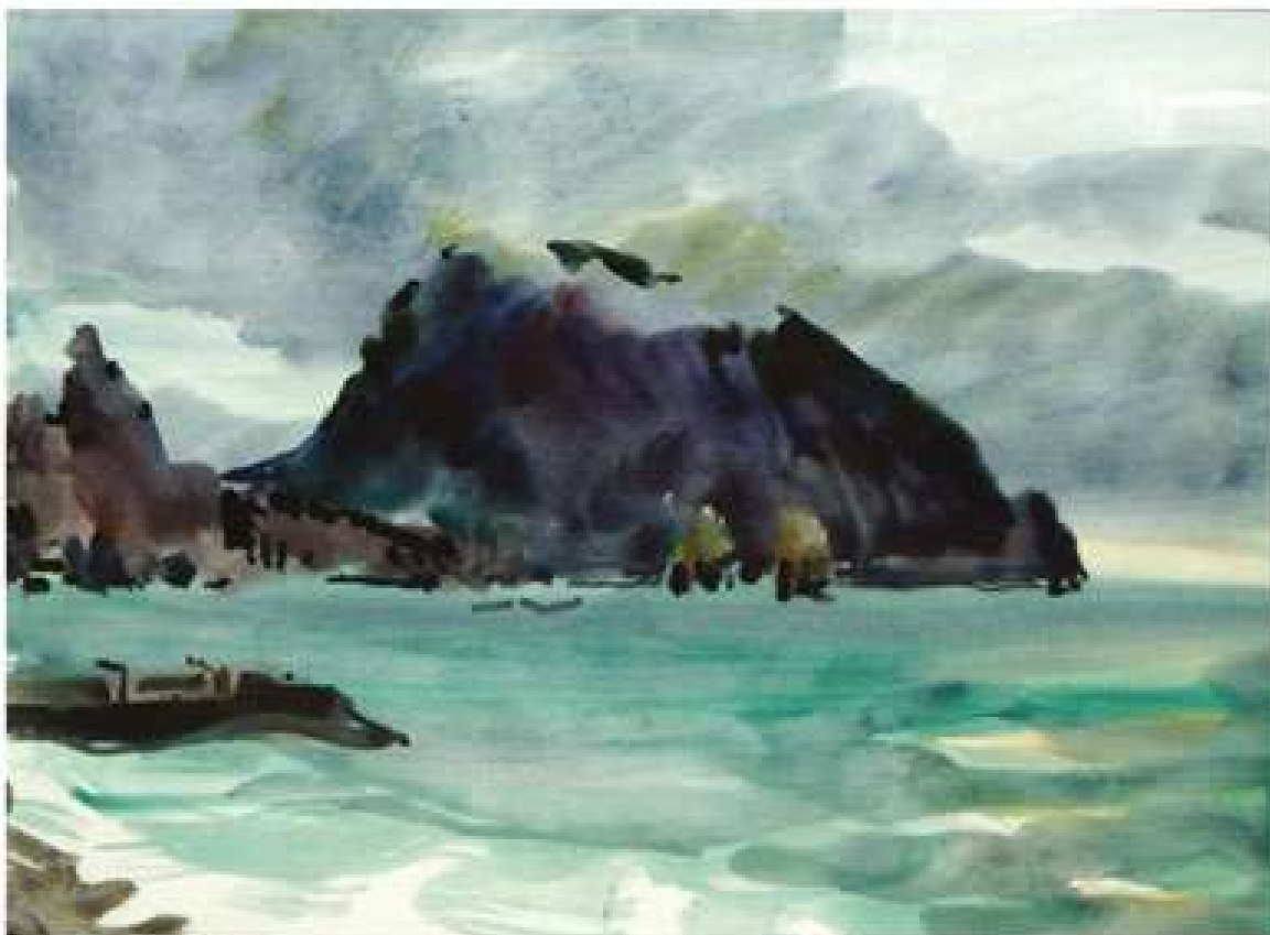
Анатолій Кравченко. Аю-Даг в Криму. 2010. Папір, акварель. 30x40