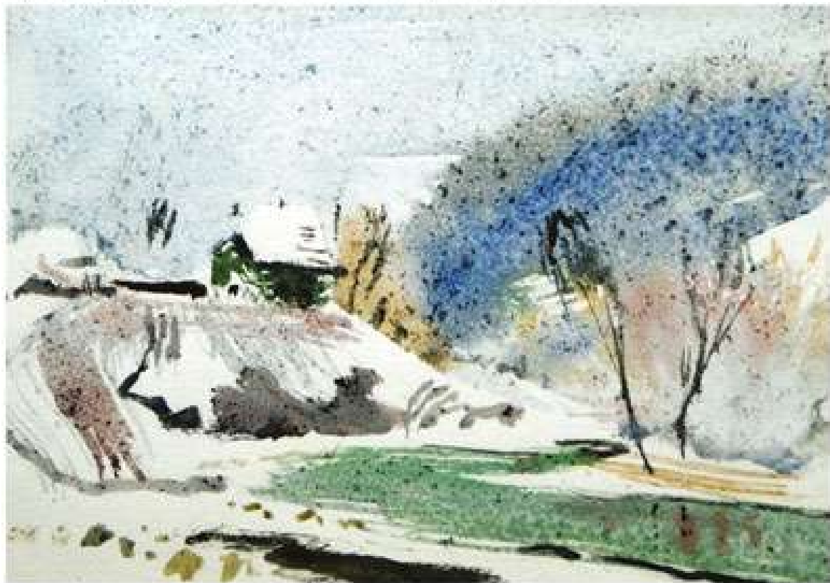
Анатолій Кравченко. Зима в Яремчі. 2010. Папір, акварель. 30x40