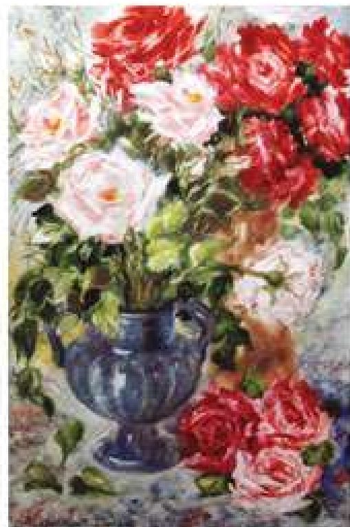
Галина Кравченко. Троянди. 2016. Папір, акварель. 38x56