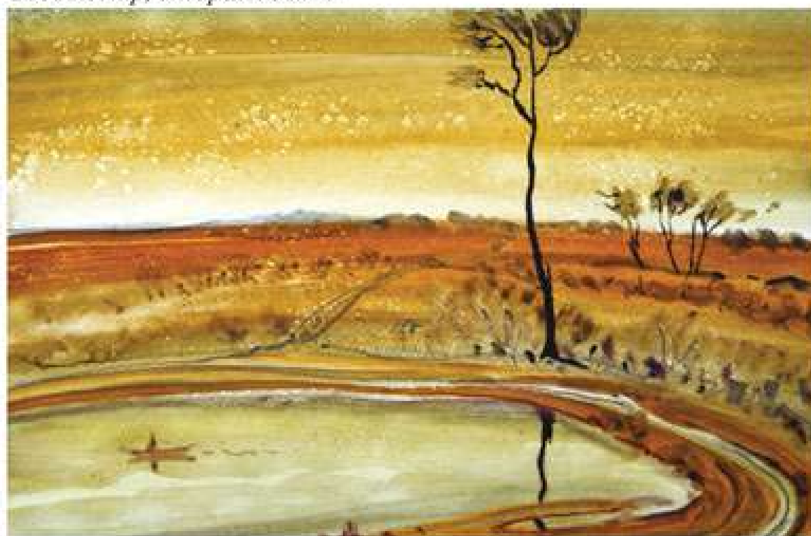
Анатолій Кравченко. Вінничина. 2013. Папір, акварель. 30x40