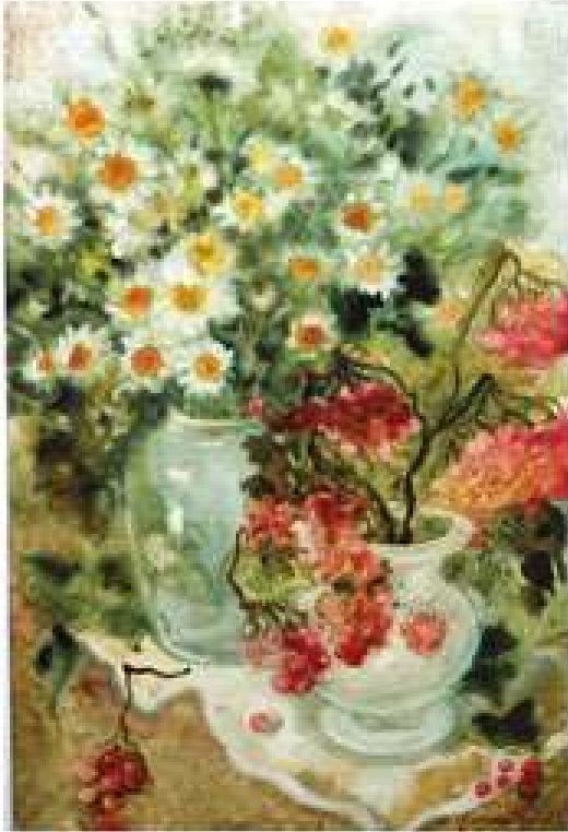
Галина Кравченко. Вересень. 2017. Папір, акварель. 60x40