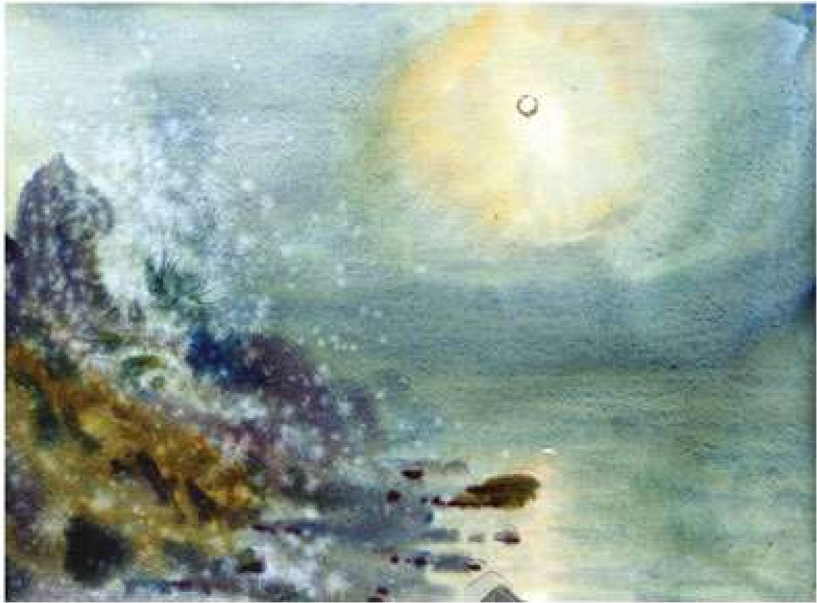
Анатолій Кравченко. Ранок на морі. 2003. Папір, акварель. 30x40